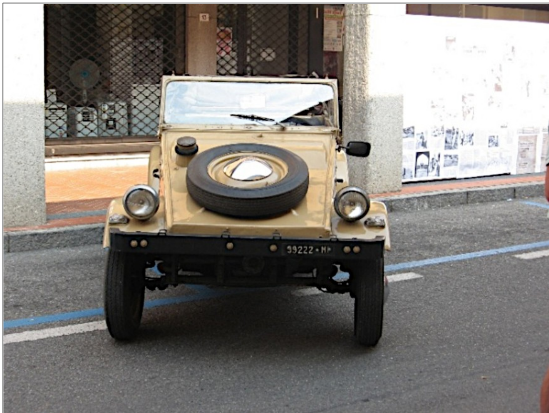
Giugno 2017: la jeep Kübelwagen fotografata in Via Pilastrello