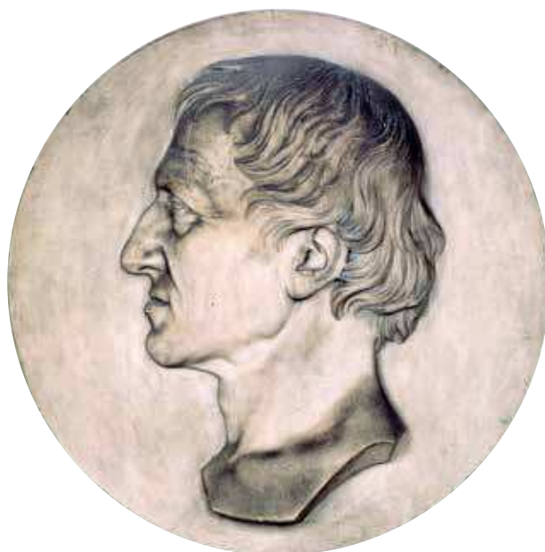
16. Ritratto di Gaetano Strambio senior. Tondo in marmo (diam. cm 60, n. inv. sculture 16. Ospedale Maggiore, Ca Granda Milano). Del monumento in marmo dello scultore Luigi Agliati (Como 1816–Milano 1863) inaugurato il 3 maggio 1861, nel trentesimo anniversario della morte del medico, rimane solo il tondo e non vi è traccia della cornice architettonica e della lapide.