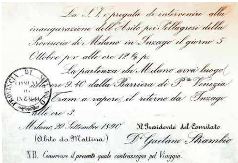
11. Biglietto di invito all'inaugurazione del Pellagrosario (da ALEMANI, 2013).

La Cronaca Trevigliese il 4 ottobre 1890 pubblica il programma dettagliato della giornata dell'inaugurazione 42 ; il 5 ottobre il giornale diretto da Carlo Bazzi uscì con un numero speciale dal costo di 10 centesimi il cui ricavato andò in favore del Pellagrosario 43 . L'avvenimento fu pubblicato su diversi giornali e riviste di Milano 44 , che avevano mandato propri redattori e dall'agenzia Stefani.