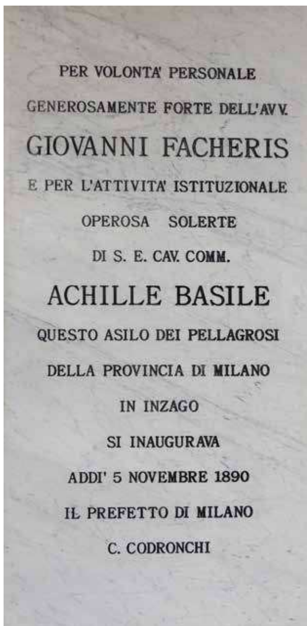
18. La nuova lapide collocata recentemente completamente diversa e con errori rispetto a quella originaria.

Recentemente, la lapide a destra dell'ingresso, essendo caduta durante i lavori di restauro finanziati dalla Provincia di Milano, ridotta in moltissimi frammenti, particolarmente consunta e per giunta ormai illeggibile, è stata sostituita da una nuova con la seguente iscrizione: PER VOLONTA' PERSONALE / GENEROSAMENTE FORTE DELL'AVV. / GIOVANNI FACHERIS / E PER L'ATTIVITA' ISTITUZIONALE / OPEROSA SOLERTE / DI S. E. CAV. COMM. / ACHILLE BASILE / QUESTO ASILO DEI PELLAGROSI / DELLA PROVINCIA DI MILANO / IN INZAGO / SI INAUGURAVA / ADDI' 5 NOVEMBRE 1890 / IL PREFETTO DI MILANO / C. CODRONCHI (fig. 18).