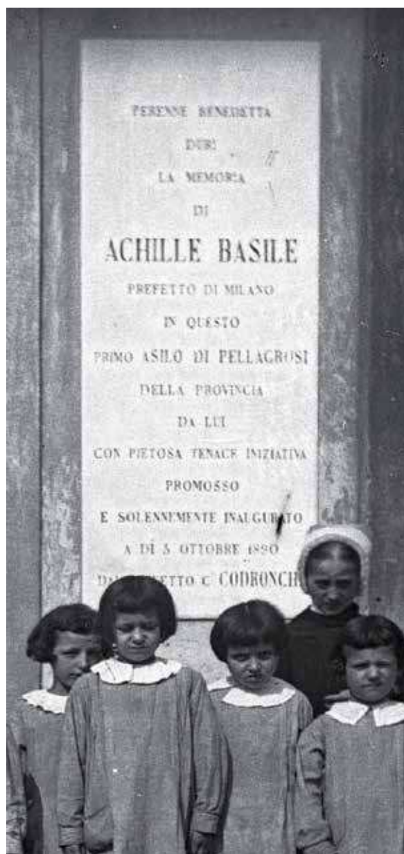
19. Particolare della lapide originaria, ora perduta, a destra dell'ingresso dell'Istituto.

Alla luce di quanto sopra argomentato, adesso, anche se l'operazione ha un costo, è possibile rimediare agli errori, che si sarebbero potuti evitare con un'attenta ricerca, sostituendo nuovamente il ricordo marmoreo. Le Istituzioni in causa, Provincia di Milano e Istituto scolastico, che ora sono a conoscenza dei fatti, se non provvederanno a rimuovere e a sostituire la lapide in oggetto saranno egualmente responsabili con chi ha dettato l'iscrizione producendo un falso con errori storici e linguistici.