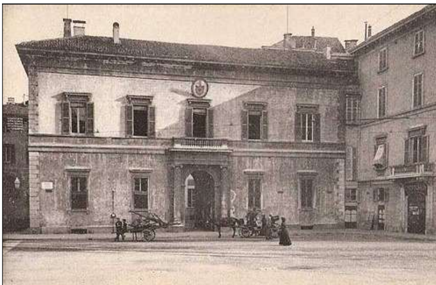
Regio Istituto Tecnico Superiore di Milano, in piazza Cavour