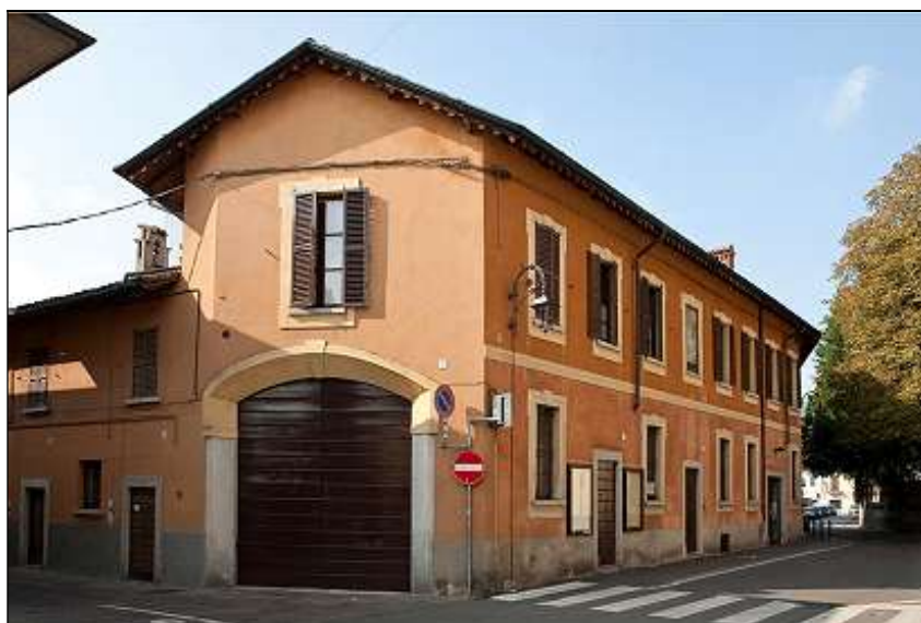
Casa Appiani (ex albergo grande) con l'ala Nord tagliata e ridimensionata per rendere più scorrevole la strada