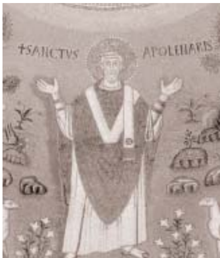
XIII secolo, prima e a stampa Anversa 1497, v. "Rivista di storia