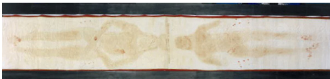
Figura 1: La copia della Sindone di Inzago. Il telo completamente disteso.