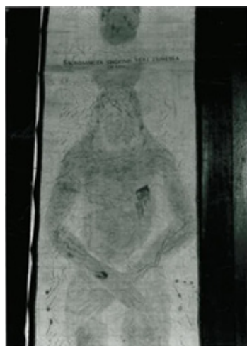
Figura 2 La copia della Sindone di Inzago. Il telo completamente disteso.