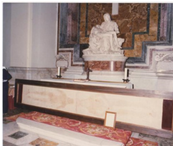
Figura 3: L'Ostensione della copia di Inzago in San Pietro, 1985