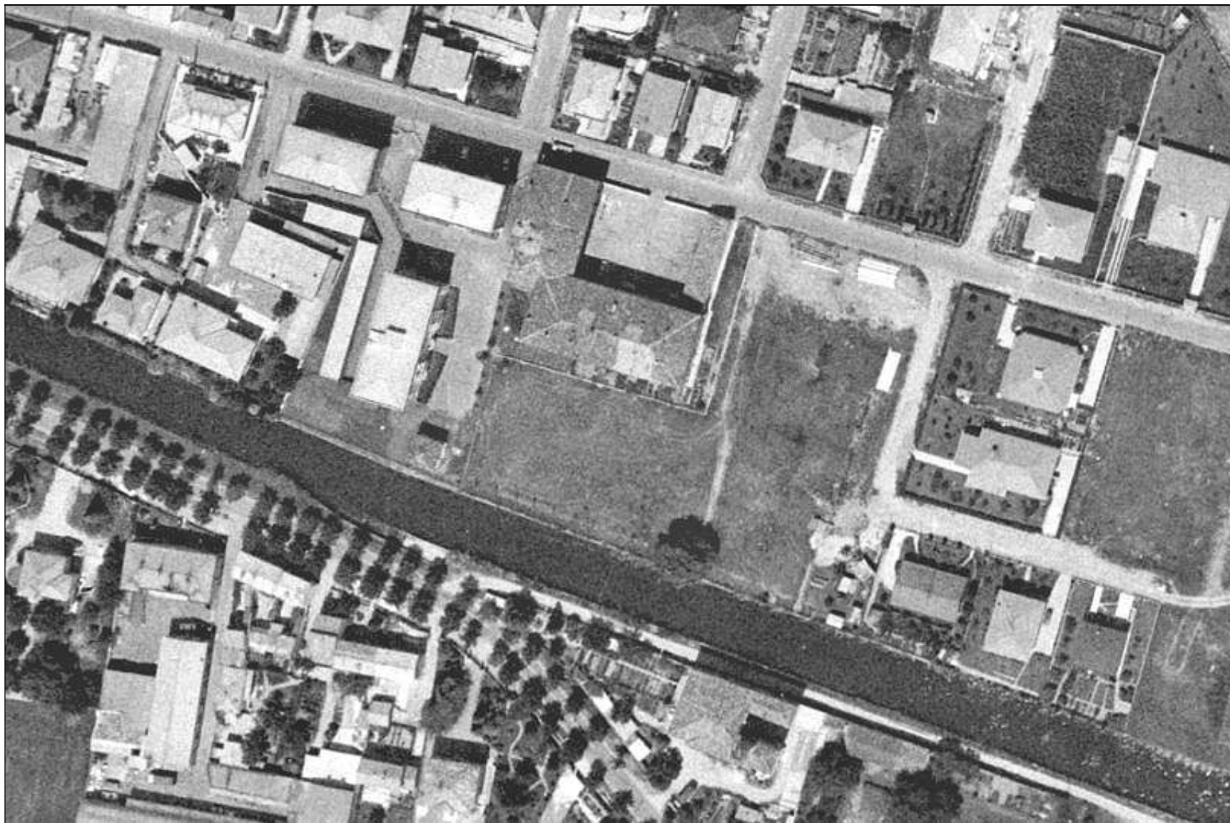
Villa Secco d'Aragona con il suo giardino prospiciente il naviglio della Martesana - 1975