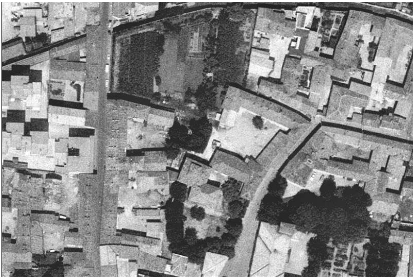
Villa Marietti con il suo giardino e la vasta ortaglia che arrivava fino alla roggia Crosina - 1975