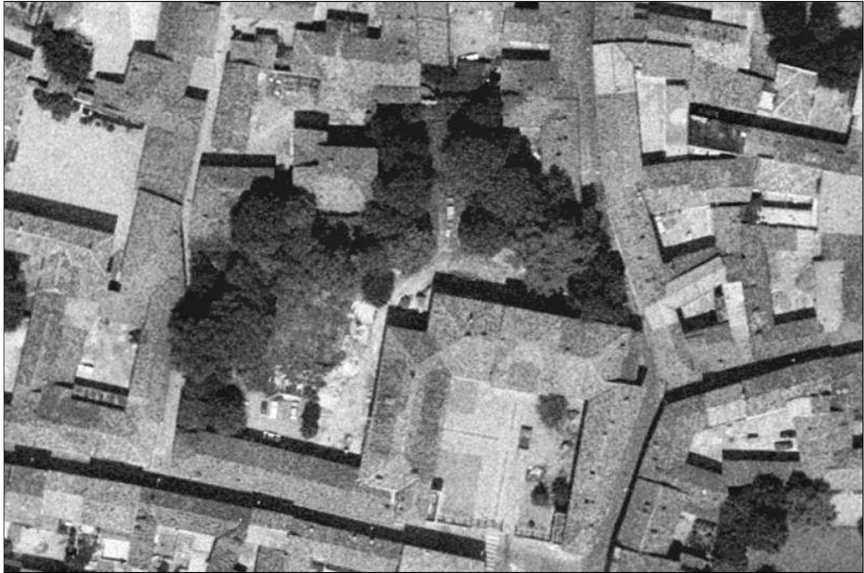
Villa Facheris con il suo giardino - 1975