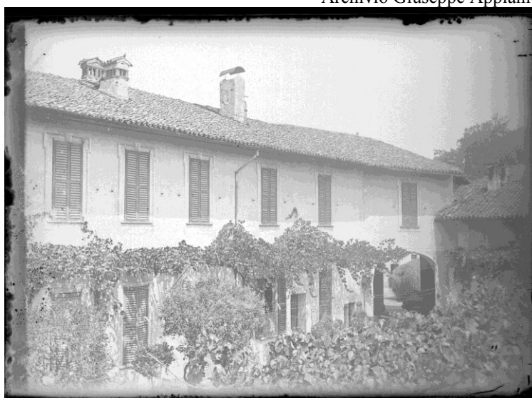
Archivio Giuseppe Appiani

Foto inizi '900 - Casa Appiani, facciata meridionale