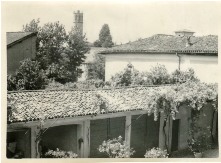
Foto inizi '900 - Ex scuderia