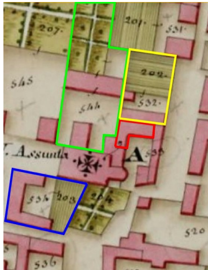
Elaborazione grafica Silvano Pirotta

profani con detrimento di quel sacro silenzio, che si bene addicasi alla santità di un tempio”; la loro demolizione avrebbe favorito poi “il decoro del tempio, ed alle processioni esterne”.