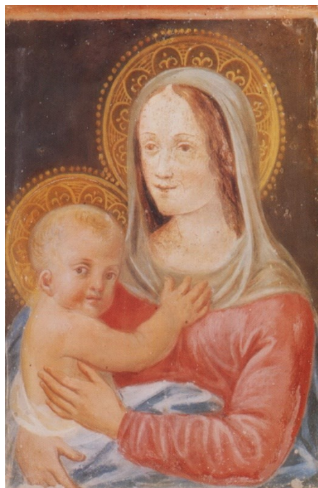
Secolo XVI –Madonna con bimbo

I radicali lavori di restauro degli interni della canonica compiuti a fine '900 hanno cancellato le tracce del suo passato, salvo un piccolo affresco con la Madonna protettrice della casa.