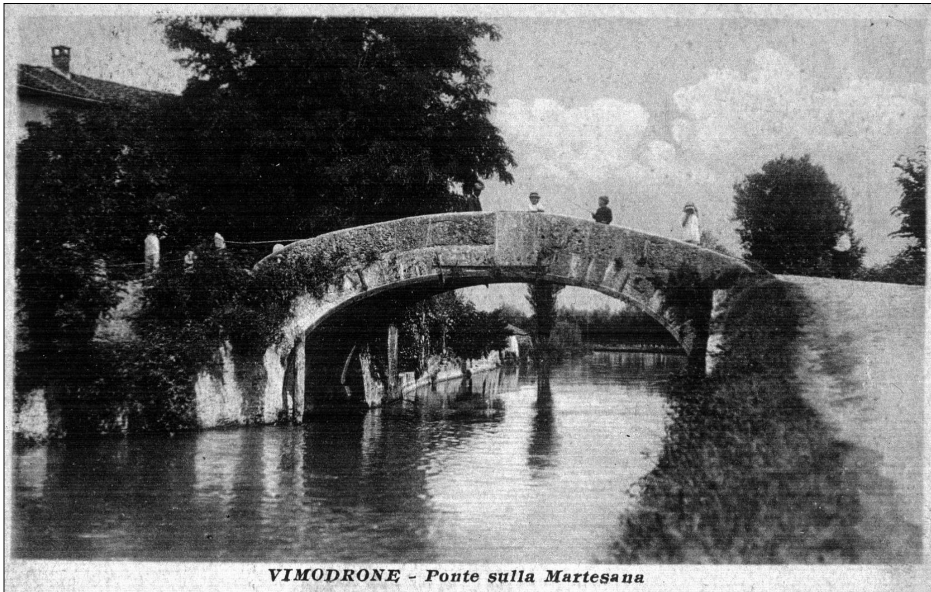
VIMODRONE - Ponte sulla Martesana

SEQUENZA DI TRE IMMAGINI, CHE MOSTRA L'EVOLUZIONE DEL PONTE DEL CENTRO STORICO DI VIMODRONE SOPRA IL NAVIGLIO DELLA MARTESANA (qui sotto nei primi decenni del '900)